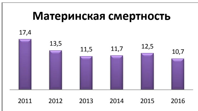
Рисунок 1 - Наличие снижения показателя материнской смертности с 2011 по 2014г. Незначительный прирост в 2015г. на 3% в сравнении с 2014г.

Структуру материнской смертности в Республике Казахстан с 2011г по 2016г наглядно показывают следующие рисунки 1 и 2.